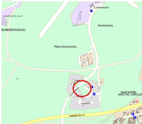
Kuva 2. Suunnittelualueen sijainti

Kaavamutosalue sijaitsee 18. kaupunginosassa Lentokentätien ja Innokaaren sekä Teknotie ja Lentokentätien välisellä alueella. Virkistysalueet rajoittuvat rakennettuihin katuihin. Vaikutusalue käsittää lähiympäristön kortteli- katu- ja virkistysalueet.